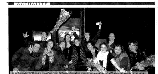
Le 5 o avril 2009 un prix est remis aux artistes de la région de la culture des Laurentides.